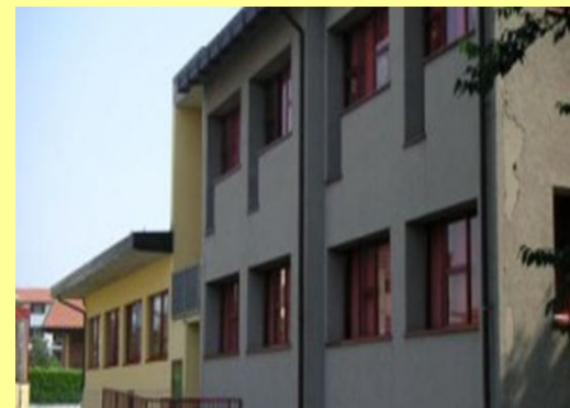
Stadio Via XXV Aprile, 40