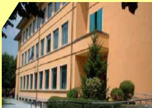
De Amicis Via XXV Aprile, 4