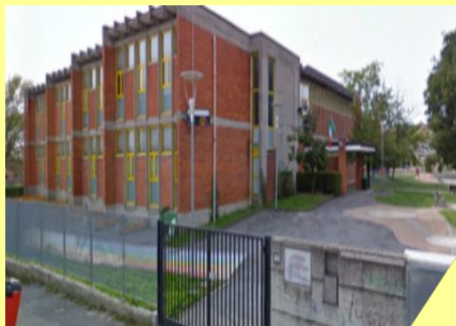
Pascoli Via Cavalli