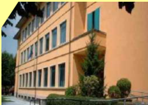
De Amicis Via XXV Aprile, 4