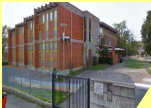
Pascoli Via Cavalli, 2