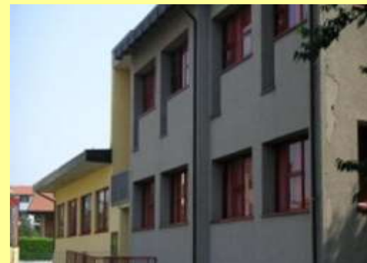
Stadio Via XXV Aprile, 40